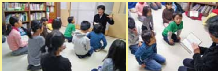
写真は2011年11月の素読。言葉の響きに親しむいつもの様子。