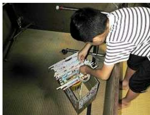
(K君がかたつむりを守る家を作っているところ)

先週の「やまびこクラブ」では、チラシとダンボールという素材で遊びました。雨の中、家の中で、「ターザンごっこ」に近いことをしていたように感じます。