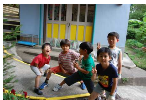
やった！いっぱい採れた