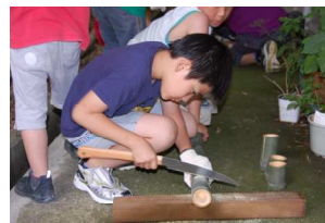
まっすぐに刃を動かすよ