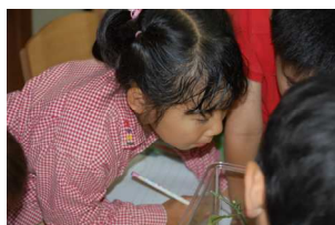
えっとなんだったっけ？