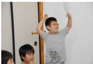
やった！ぼくから発表

などで、内容はバリエーションに富んでそれぞれスケッチの絵も可愛らしくて大変ユニークです。