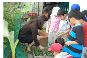
たくさん育ったね