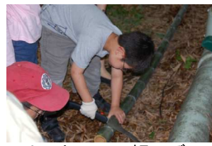
よっしゃー、切るぞ