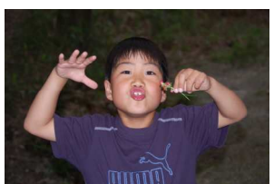
ほらっ、ヘビイチゴだ