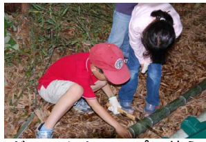
どのへんをコップに使う？