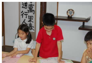
これ、発表しようかなあ