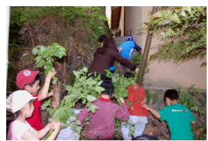
採れたらもどりましょう