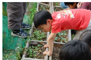
うーん、これでよし