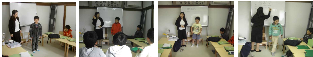
まずは上級生より順に自己紹介です。 しぜんについて自分の好きなことも一つずつ伝えます。

4月17日(火)3時50分になり、次々と懐かしい笑顔が山の教室に集まりました。大勢の1年生を迎え、3、4年生上級生も新しい仲間が増えることをとても楽しみに待っていました。女の子も二人、メンバーに加わりました。嬉しかったですね！さあ、いよいよしぜんクラスの再スタートです。