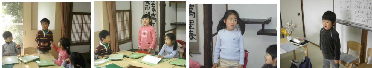
大きな声でしっかりと言えました。 終わったら拍手です。みんなの名前をおぼえられたかな？