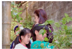
では、次のグループさん