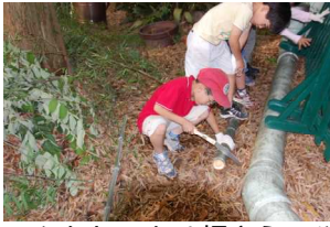
みんなしっかり押さえてや