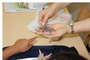
Rちゃんが海で拾ったヒトデ