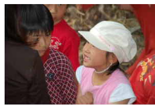
私って、身軽でしょう！