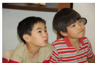
真剣な眼差しで聞く