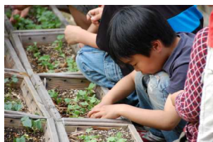
なかなか難しいなあ

次に、5月8日のクラスで土を掘り起こし柔らかくして新しい土と肥料を混ぜて「さやいんげん」と「二十日大根」を植える作業を済ませましたが、その後、すくすく育っている様子を観察しながら、子葉から本葉へ成長途中の芽を等間隔になるように間引き作業しました。