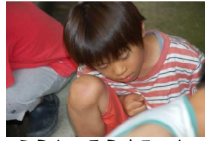
ふうん、そうするのか