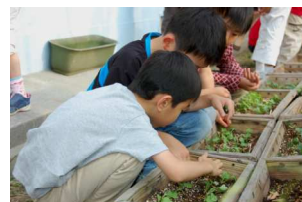
これとこれを抜いたら