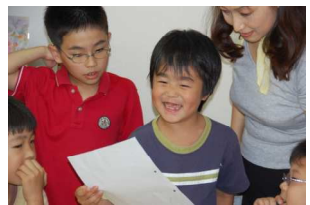
しっばい、もう一回よむね