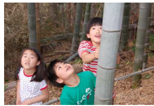
うわあ、たっかいなあ！