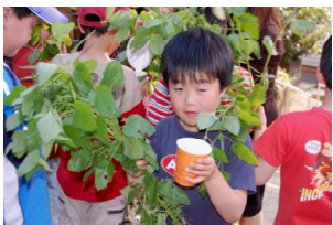
そしてお水に浮かべると