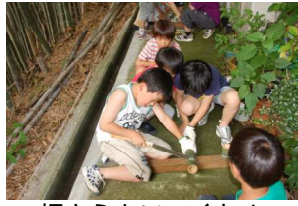
押さえといてくれよー