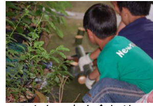
みんなで力を合わせて