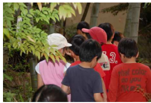
そのまま道を歩くと