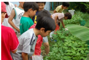
大きくなったなあ

まず、それぞれの成長具合をよく観察しましょう。日当たり、植わっている間隔が違うと実のつき方も違ったね。