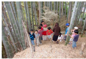
一番下についたよ