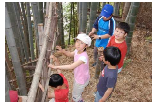
ここからが、けもの道だ