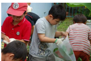
一つずつ大事にいれよう