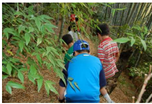
イノシシとシカのフンだ！