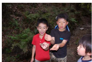
サワガニとカエルがいた