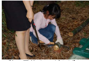
私、最後までがんばる