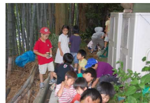
竹切りの音が響きます