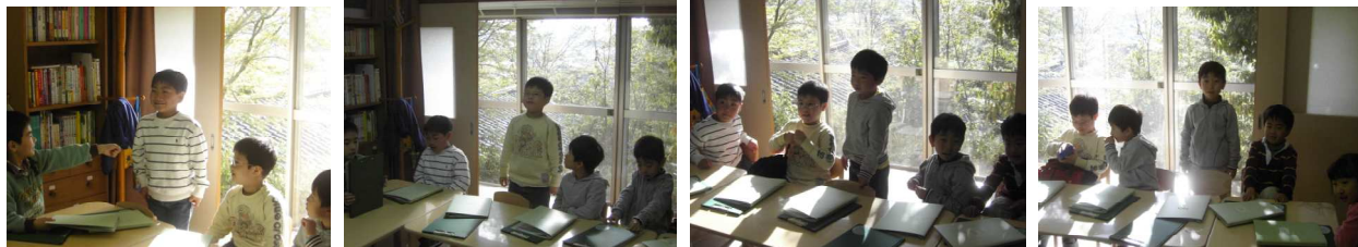
その場に立って、学校名、氏名につづいて、自分の好きな物(食べ物でもよい)を伝えていきます。