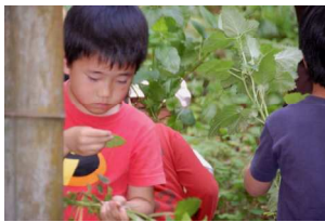
ふうん？これがハーブ