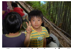
やっとできたよ、ピース