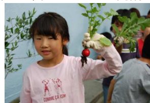
しっかり大きくなったわ