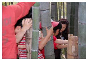
竹を掴んでさらに下へ