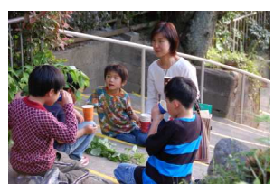
飲んだらコップ重ねます

山道から竹やぶへ入り、目、手、足の感覚をフルに使っての行程でした。大人でも容易ではない場所で、仲間に励まされたり手を取り合ったりしながらの、正に冒険と言える体験でした。けもの道では、細長いイノシシのフン、またすぐ近くにはコロコロした丸いシカのフンが2カ所に落ちているのを見つけ、この周辺にも野生動物が確かに現れていることを目で見て確認しました。