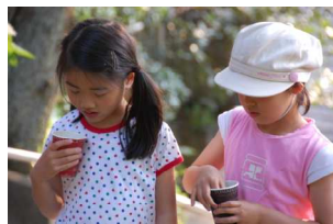
浮いてる、きれいね