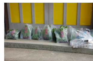
ほしぐみ前に仮置き