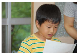
思い出しながら発表しよう