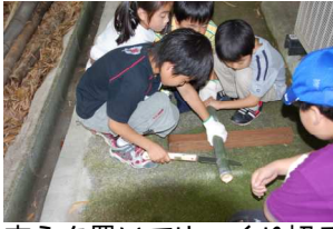
支えを置いてゆっくり切る