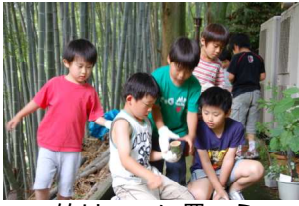
竹はここに置こう