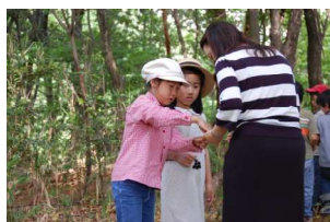
ほら、オオバヤシャブシ