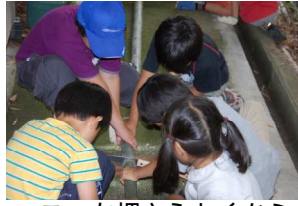
こっち押さえとくから