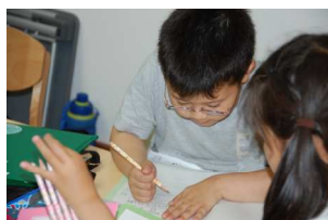
ほくも今のうち書いとう