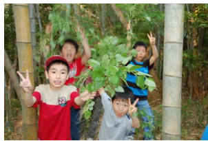
やった！いっぱいゲット