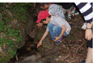
カニがいるね、隠れた？