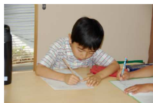
今日の活動をまとめよう