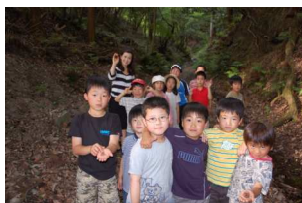
記念写真の後は教室へ戻るよ