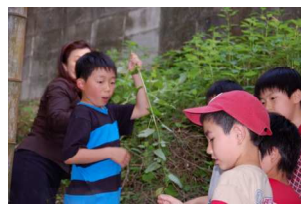
レモンバームでいっぱい！