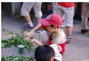
葉っぱをパーンと叩く