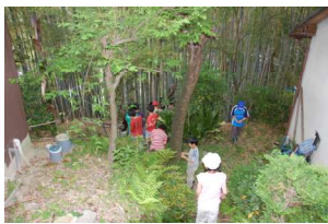
ゆっくり下ります