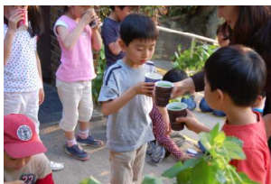
きょうの冒険に乾杯！