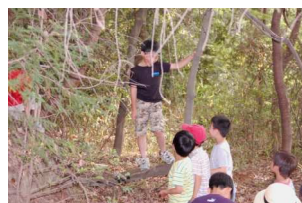
この蔓はぶら下がるよ