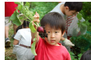
土つきの二十日大根だよ