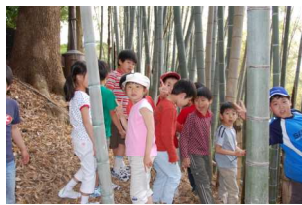
笹の積もった竹やぶ