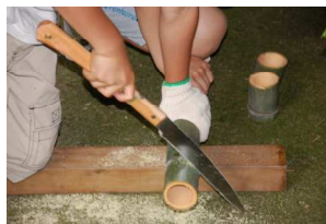
こういう感じで切るんや