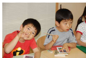
にこやかにピース、よし鉛筆で書きとめておこう