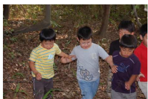
そっちは気をつけて