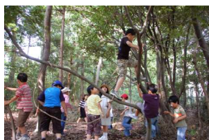
ここまで登れるよ

6月5日(火)、この日は「ジュニア・フォレストアーツ」(森の活動)について、本を見ながら進めました。上級生は今までの活動を振り返り、1年生は入門の第一歩として“ひみつの森”を訪ねることになりました。育てている野菜の成長を確認したら、園庭から山奥へ入ります。道々、上級生が説明してくれます。 [今までの活動：森を探検する 森の手入れをする 森の基地づくりをする 森であそぶ]