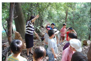
奥の方へいってみよう