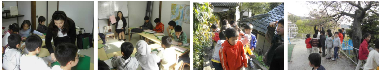
では、しぜん日記の用紙を配ります。後半は外へ出てリーダーを先頭に、ゆっくり「春めぐり」です。