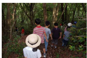
では、川へ下ります