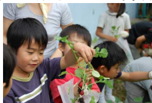
大きい実と小さい実