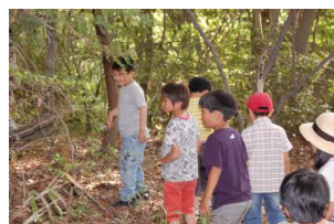
手入れをしたところだよ