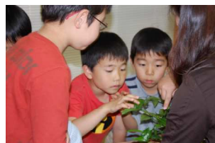
頭をついたら肉かくを出して驚くアゲハ ミカンのとげは痛いよ